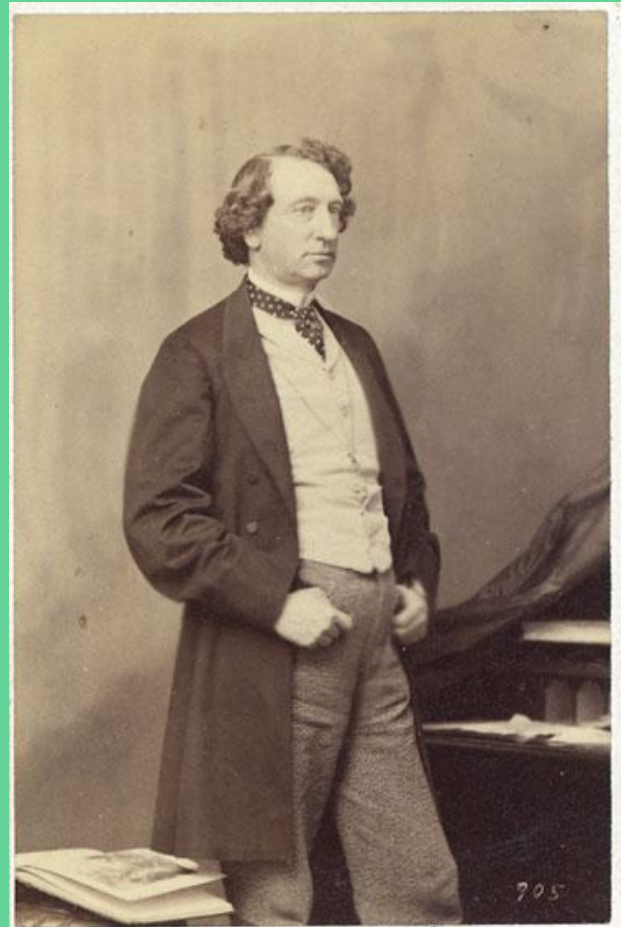
Sir John A. Macdonald.