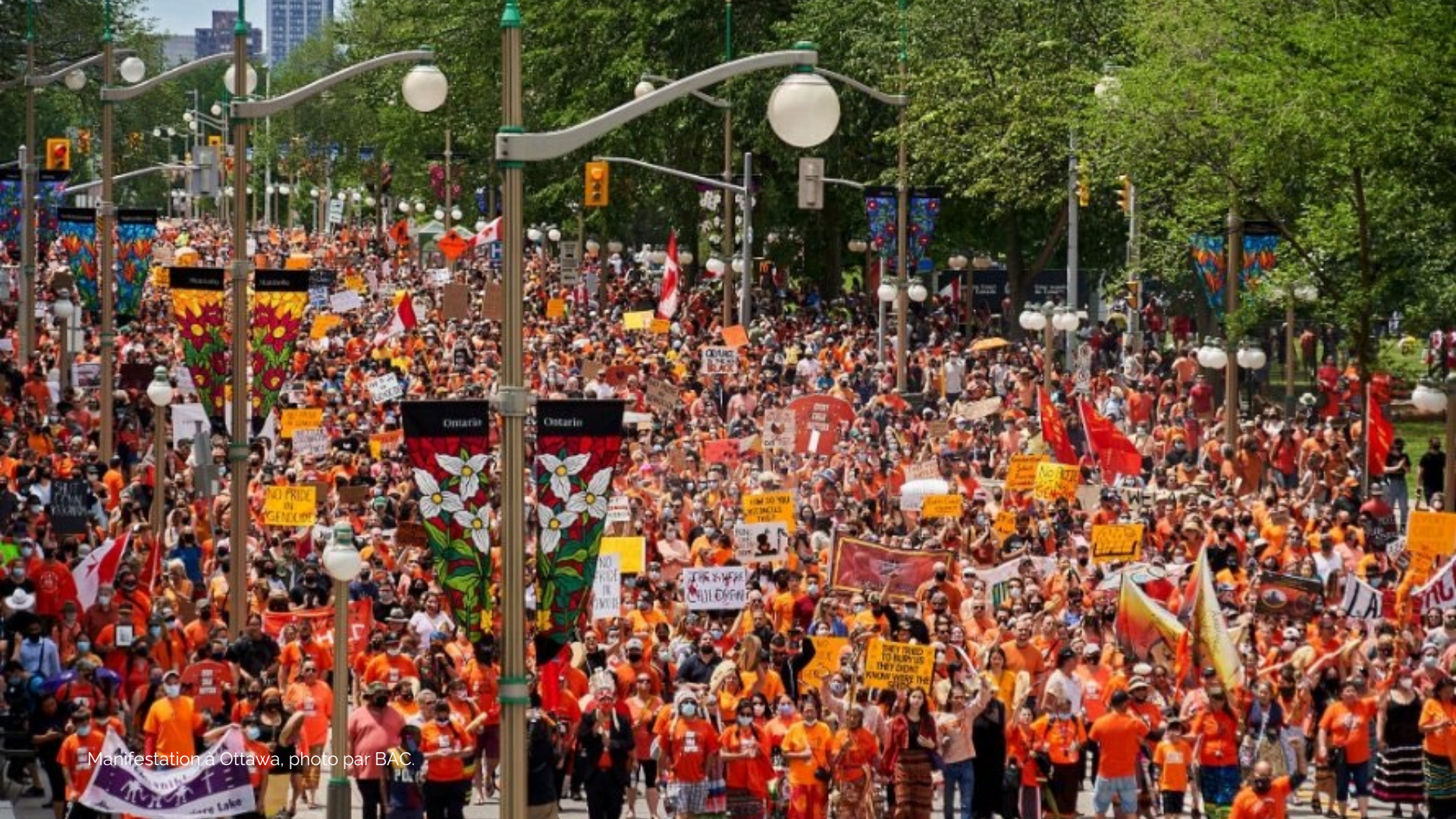
Manifestation à Ottawa, photo par BAC.