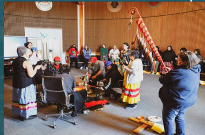
"Visite du Traité 3", photos par BAC.