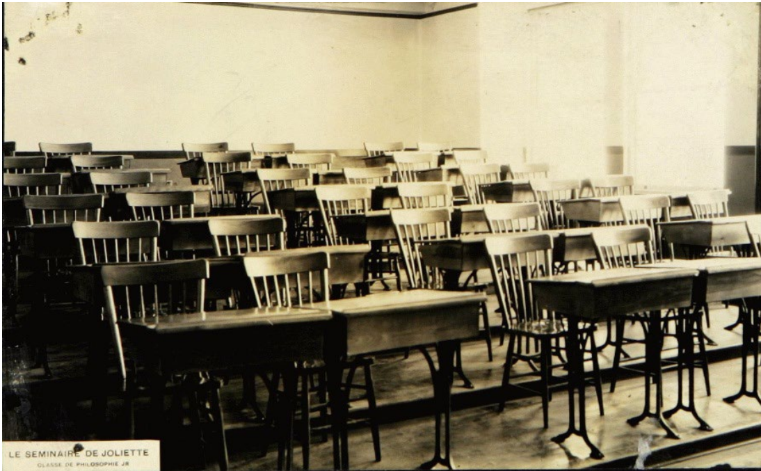
Le Séminaire de Joliette, Classe de philosophie Jr., Montréal, O. Allard, artiste-photographe, [19--?].