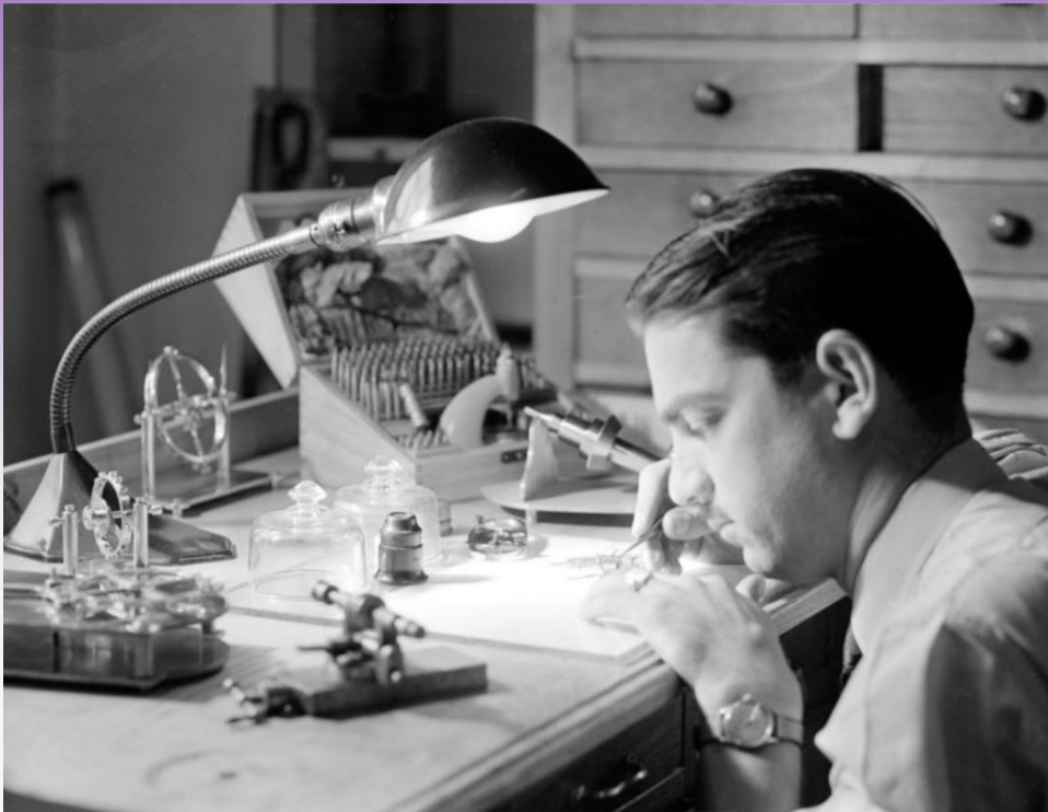
Service d'apprentissage, ministère du Travail, septembre 1949. Archives nationales à Montréal, fonds Ministère de la Culture et des Communications (E6, S7, SS1, D48273-48274).