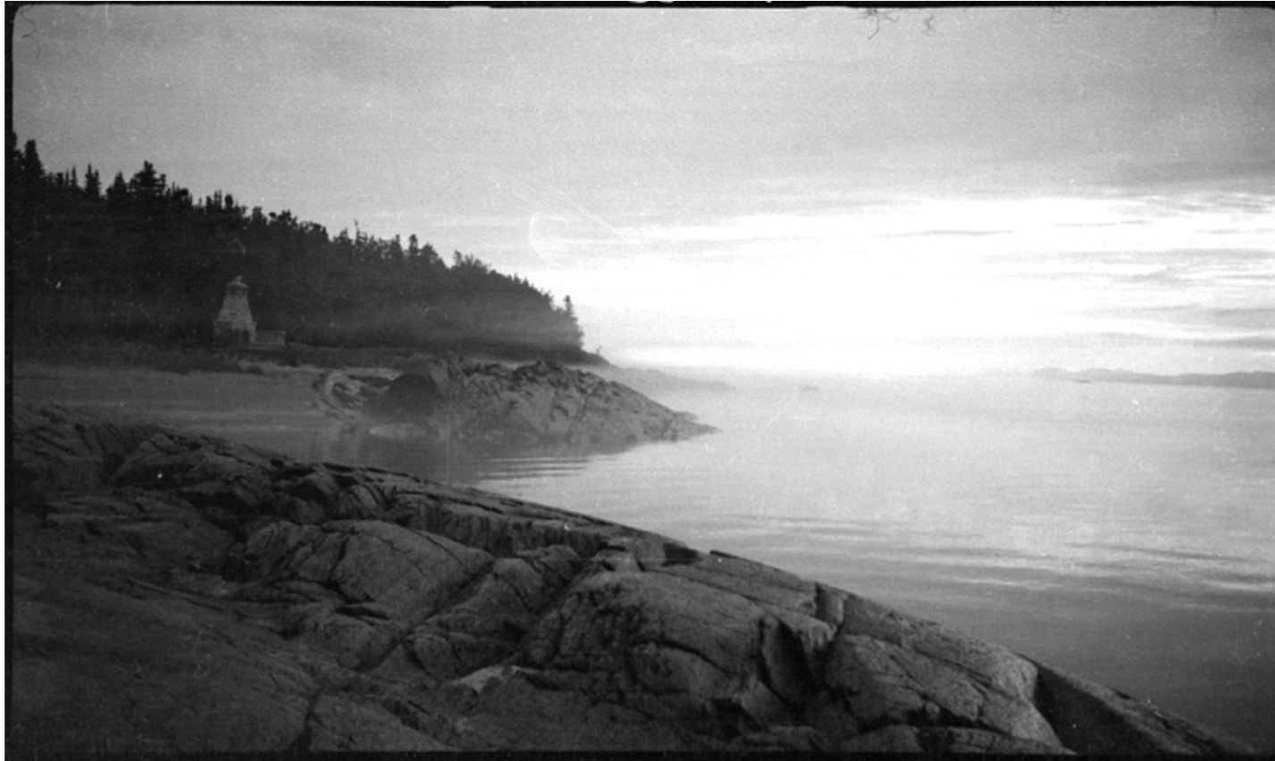
Vue de l'île aux Basques, comté de Rivière-du-Loup, 1938. Archives nationales à Québec, fonds Ministère de la Culture et des Communications (E6, S7, SS1, P265). Photo : Marc Leclerc.