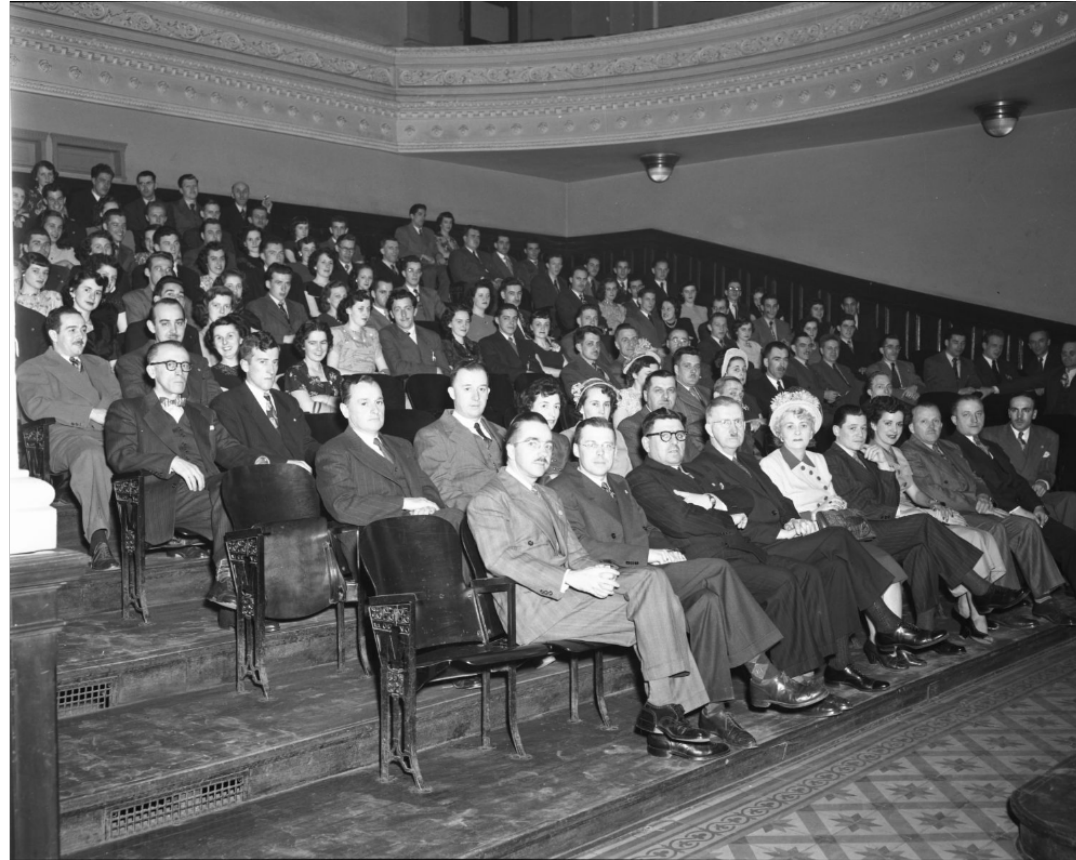
Conférence de Fernand Dostie, 1949. Archives nationales à Québec, fonds Ministère de la Culture et des Communications (E6, S7, SS1, P68883). Photo : Neuville Bazin.