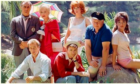
Les Joyeux naufragés (CBS)