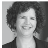
Hélène Laverdure conservatrice et directrice générale des Archives nationales à Bibliothèque et Archives nationales du Québec